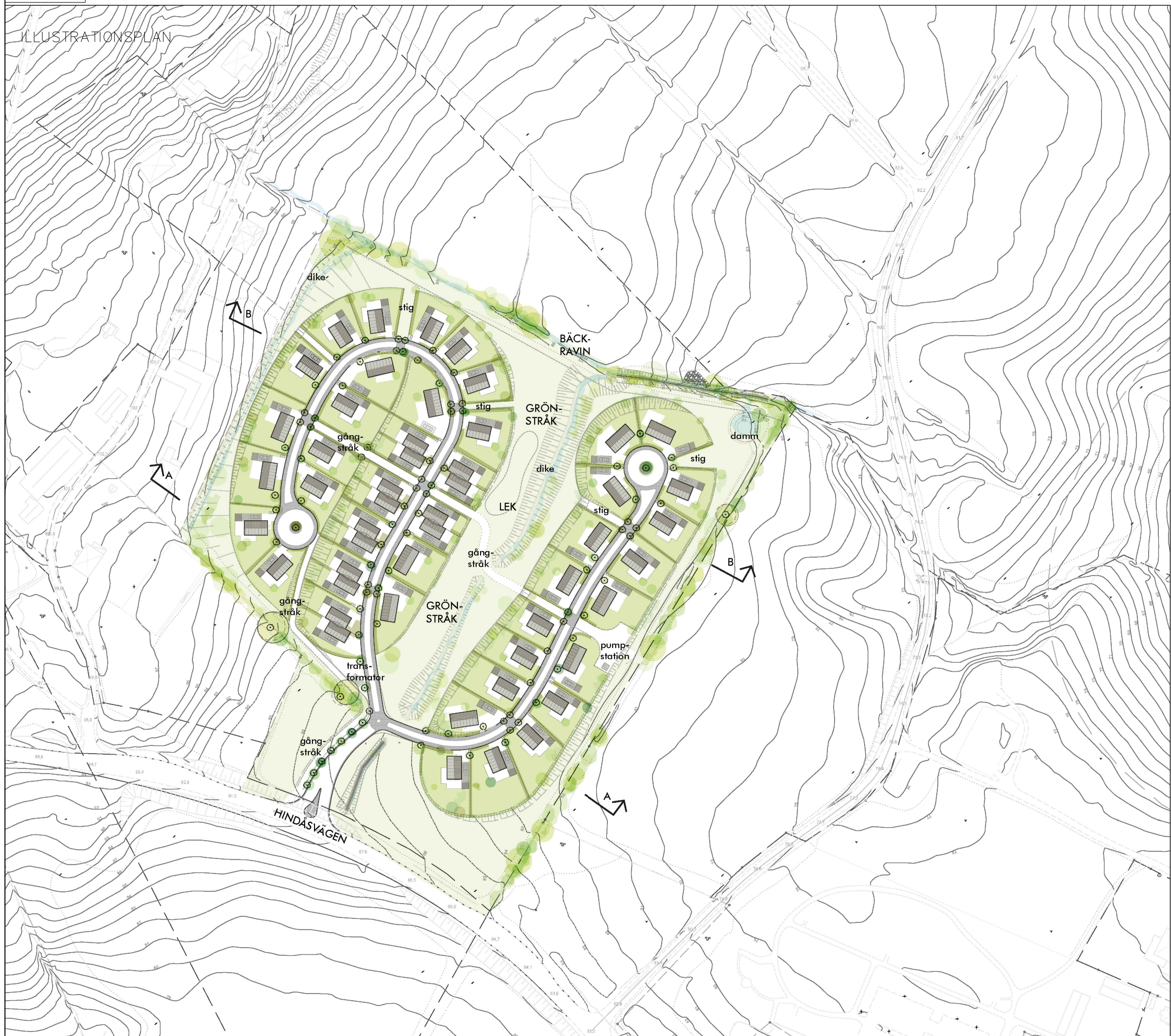
Illustrationen är ritad av Sweco